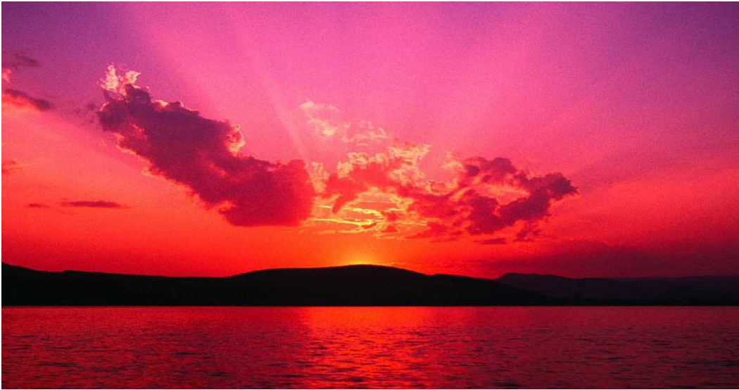
Εικόνα 4.1. Άποψη της περιοχής δειγματοληψίας.